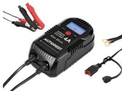
chargeur de batterie